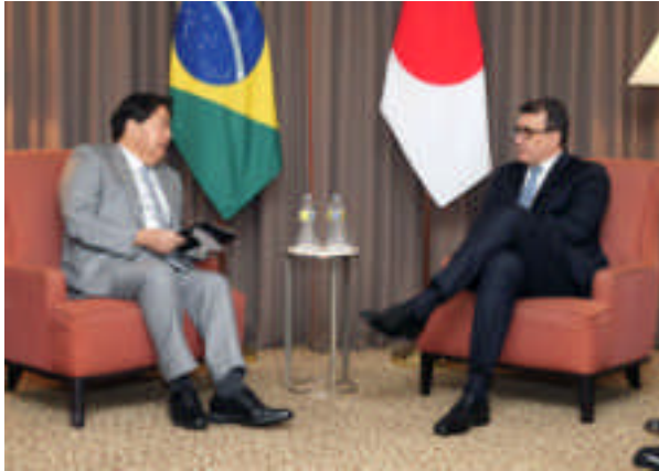
Reunión de ministros de Asuntos Exteriores de Japón y Brasil (22 de septiembre, Nueva York, Estados Unidos)

la cooperación estratégica entre ambos países en el ámbito internacional. En septiembre, el ministro de Asuntos Exteriores Hayashi se reunió con su homólogo brasileño Carlos França con motivo de la Asamblea General de la ONU y confirmó que Japón y Brasil, miembros no permanentes en el Consejo de Seguridad en 2023, trabajarán juntos para fortalecer las funciones de la ONU en su conjunto, incluida la reforma del Consejo de Seguridad, teniendo en cuenta que el Estado de derecho adquiere cada vez mayor importancia. También coincidieron en que las relaciones económicas Japón-Brasil tienen un gran potencial y acordaron discutir iniciativas sobre el 5G y la descarbonización. Además, se ha reactivado el diálogo entre ambos países, con la Reunión de Sabios de la Asociación Económica Estratégica Brasil-Japón, celebrada en julio, la Reunión Plenaria del Consejo Empresarial Brasil-Japón, la Reunión Mixta de Consultas entre Autoridades Consulares y la Comisión de Cooperación Científica y Tecnológica, celebradas en septiembre.