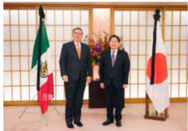
Reunión de ministros de Asuntos Exteriores de Japón y México (26 de septiembre, Tokio, Japón)

En septiembre, el ministro de Asuntos Exteriores Hayashi, se reunió con su homólogo