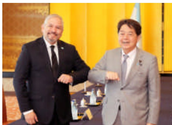
Reunión de ministros de Asuntos Exteriores de Japón y Honduras (4 de julio, Tokio, Japón)

En enero, el enviado especial de Japón, UTO