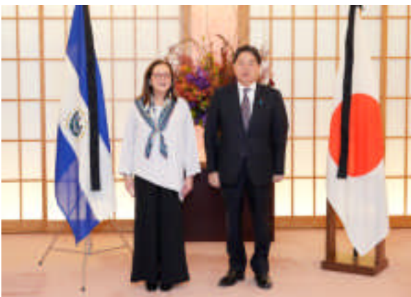
Reunión de ministros de Asuntos Exteriores de Japón y El Salvador (26 de septiembre, Tokio, Japón)