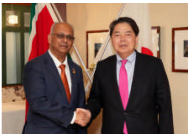
Reunión de ministros de Asuntos Exteriores de Japón y Surinam (21 de septiembre, Nueva York, Estados Unidos)

Japón lleva a cabo una diplomacia basada en los tres pilares de la cooperación con la CARICOM ((1) cooperación hacia un desarrollo sostenible, incluida la superación de las vulnerabilidades inherentes a los pequeños Estados insulares, (2) ampliación y profundización de los lazos de cooperación y amistad, y (3) cooperación en la resolución de los diversos desafíos de la comunidad internacional). Japón proporciona también la cooperación necesaria a los países con altos niveles de renta, de acuerdo con sus necesidades de desarrollo y su capacidad económica. Por ejemplo, en febrero, Japón firmó un acuerdo para proporcionar asistencia financiera no reembolsable a cinco países miembros de la CARICOM para combatir los daños causados por el alga Sargassum, que está