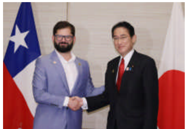
Cumbre Japón-Chile (17 de noviembre, Bangkok, Tailandia.)