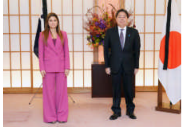
Reunión de ministros de Asuntos Exteriores de Japón y Panamá (26 de septiembre, Tokio, Japón)

cooperación con los países latinoamericanos y del Caribe teniendo también en cuenta esta iniciativa.