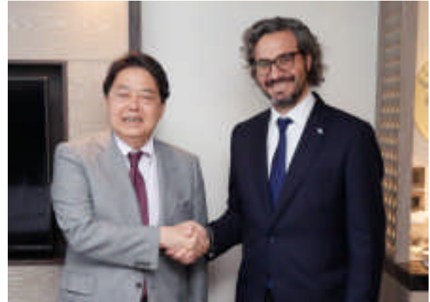
Reunión de ministros de Asuntos Exteriores de Japón y Argentina (7 de julio, Bali, Indonesia)

En marzo, el Gobierno de Alberto Fernández estableció un nuevo programa con el Fondo Monetario Internacional (FMI) para financiar de inmediato la reestructuración de la deuda externa pendiente, y, en octubre, llegó a