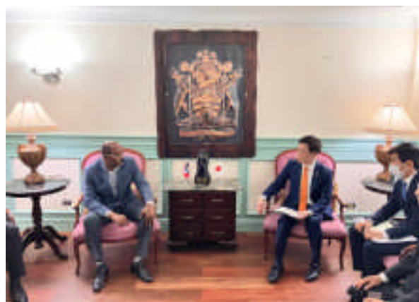
Reunión del viceministro parlamentario de Asuntos Exteriores AKIMOTO Masatoshi con el primer ministro Gaston Browne (4 de octubre, Antigua y Barbuda)