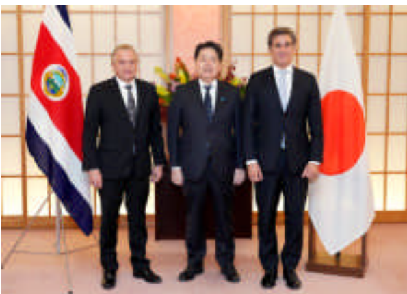
Reunión del ministro de Asuntos Exteriores de Japón con los ministros de Asuntos Exteriores y de Comercio Exterior de Costa Rica (8 de noviembre, Tokio, Japón)