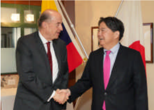
Reunión de ministros de Asuntos Exteriores de Japón y Colombia (21 de septiembre, Nueva York, Estados Unidos)

presidenciales en junio, asumió la presidencia en agosto. El Gobierno de Petro ha estado trabajando en iniciativas para lograr la “paz total” también con los grupos armados, que no participaron en la implementación del acuerdo de paz de 2016 4 , en la reforma fiscal y en la normalización de las relaciones con Venezuela.